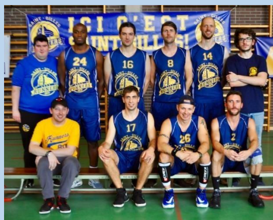
P2 Hommes (2019-2020)